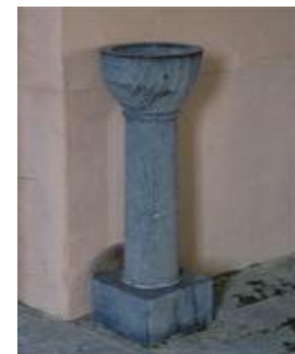
Les fonts baptismaux,