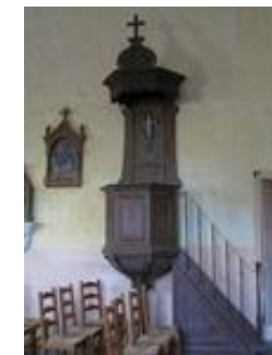
La chaire à prêcher,