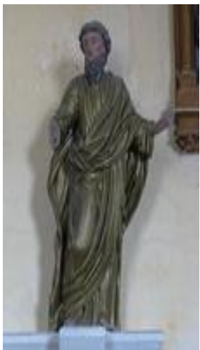
Statue de Saint Luc