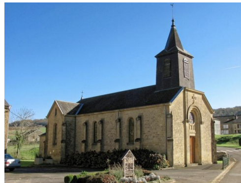
LE COQ DU CLOCHER