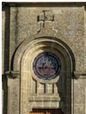
Tympan du portail occidental