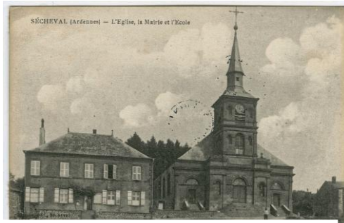
L'Eglise, la Mairie et l'Ecole. En 1900

Le 20 décembre 1953 : Baptême d'une des cloches fêlées par fait de guerre), après refonte.