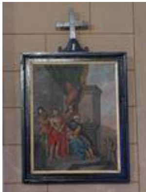
Détail du chemin de croix et des vitraux