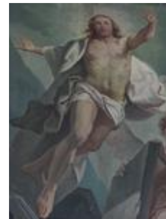
Détail de La Résurrection du Christ Tableau situé derrière le maître-autel

Il formait le retable de l'autel de la Vierge. Déposé dans la sacristie, il fut démonté en juin 1958, consolidé et envoyé aux archives départementales des Ardennes avant de revenir dans la commune en 2012.