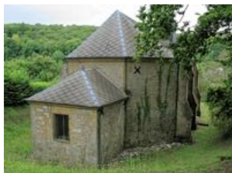
Le chevet et la sacristie depuis le nord-est