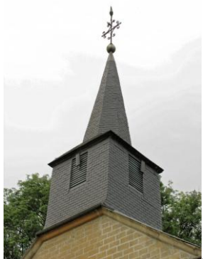
Détail du clocher