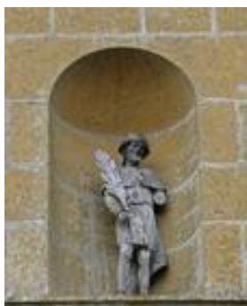
Statue de saint Arnould