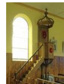
Chaire à prêcher