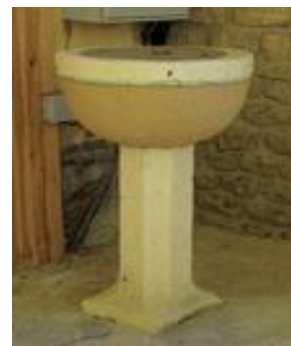
Les fonts baptismaux

La plupart du mobilier date de la construction de l'église au milieu du XIXe siècle, excepté la croix monumentale du XVIIe siècle qui a été déplacée de l'ancien cimetière et le reliquaire de saint Arnould qui a été acquis à la fin du XIXe siècle.