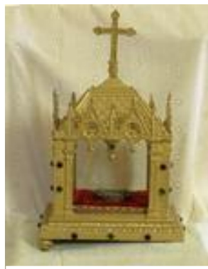
Châsse reliquaire de saint ARNOULD

L'église de Gruyères conserve une superbe statue de Saint Arnould du XVII ou XVIIIème siècle, représenté en pèlerin, vêtu en habit de Saint Jacques de Compostelle, tenant une palme évoquant son martyre.