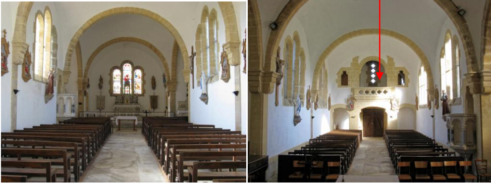
Vues depuis l'entrée et depuis le chœur

Les volumes intérieurs sont couverts de voûtes en berceau.