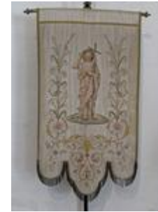
Bannières de Saint Jean-Baptiste et de La Vierge

Épisodes de la vie de saint Jean-Baptiste ; saint Dominique ; saint Lazare